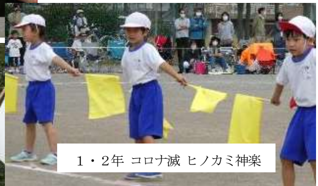
1・2年 コロナ滅 ヒノカミ神楽