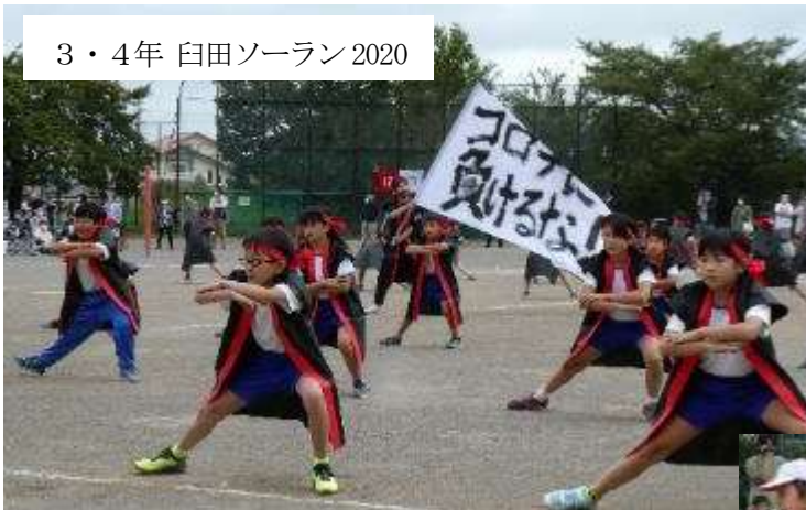
3・4年 白田ソーラン2020

コロナ禍での運動会でしたが、皆様にご理解、ご協力いただきながら、できる限りの感染症予防対策を講じて、令和2年度の運動会を9月19日（土）に開催しました。「挑戦 みんなで力をあわせてやりきろう！」という運動会スローガンのもと、子どもたちは最後まで全力で頑張りました。分散してのご観覧をお願いすることとなってしまいましたが、多くの方々にご来校いただき、ご声援をいただきました。ありがとうございました。