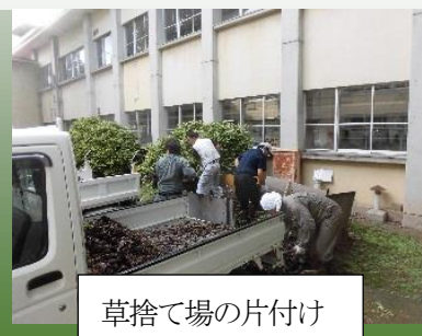
草捨て場の片付け