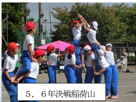
5, 6年 決戦稲荷山

運動会という行事を通してどういう力をつけるか各学年の実態に応じて考えてきました。当日はもちろんですが、子どもたちの練習の過程の中にたくさん成長する姿を見ることができました。