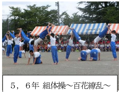
5, 6年 組体操～百花繚乱～