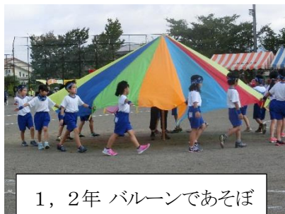
1, 2年 バルーンであそぼ

今年度は天候やグランド状態を考慮し、9月18日（火）に延期して運動会を実施しました。「今までの練習の成果を出し切ろう」の運動会スローガンに向かって、子どもたちは最後まで頑張りました。平日にもかかわらず、ご来賓、保護者、地域の皆様、多くの方々にご来校いただき、ご声援いただきました。ありがとうございました。