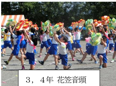
3, 4年 花笠音頭